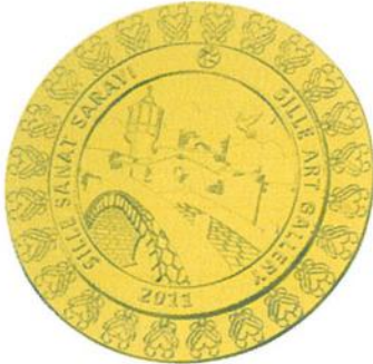
SSS Altın Madalya

Sille Sanat Sarayı altın, gümüş ve bronz madalayaları çelik metalden üretilmiş olup gerçek altın, gümüş ve bronz değildir. Düzenlenen diğer fotoğraf yarışmalarında olduğu gibi verilen ödülün değerini belirlemek amacıyla bu şekilde adlandırılmıştır