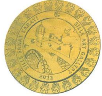
SSS Bronz Madalya